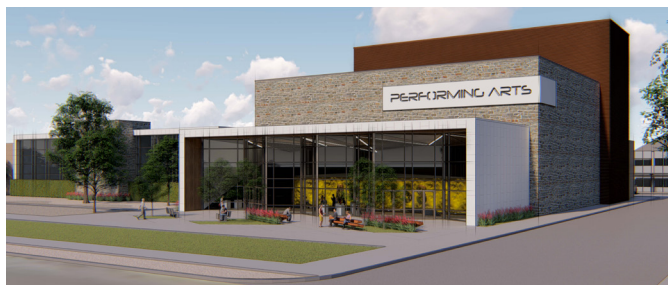
Fotos: Encabezado - Representación del Centro de Bellas Artes de El Paso