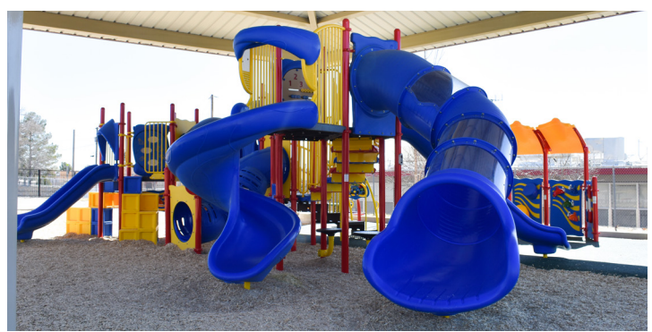
Fotos: Arriba a la izquierda- Moreno Elementary, Arriba a la derecha- Cooley Elementary, Abajo a la izquierda- Western Hills Elementary, Abajo a la derecha- Hillside Elementary