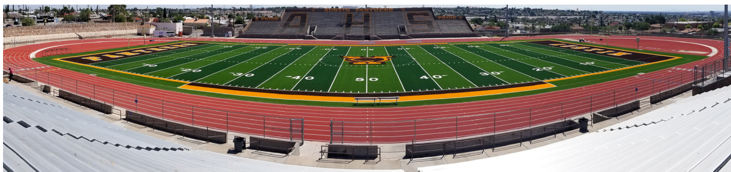
Austin High School