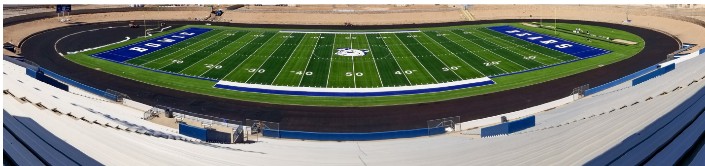
Bowie High School