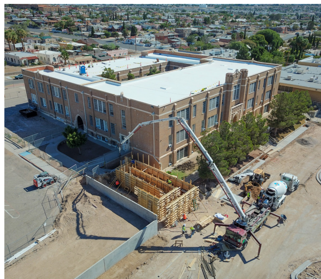
Fotos: Encabezado- Escuela primaria Crockett en construcción Centro- Estudiantes de Crockett celebrando en el inicio del proyecto Foto de abajo - Foto desde dron de Crockett en construcción