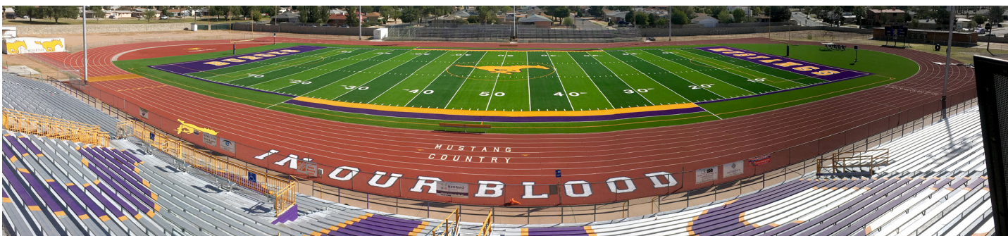
Burges High School